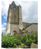
Clocher de Lavardens